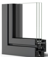
Folha nivelada PULS