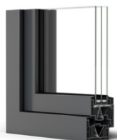
Folha Z64 PULS